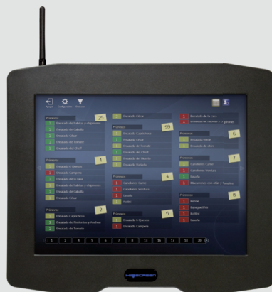
Το HioScreen απεικονίζει τα πιάτα προς παρασκευή και παράδοση