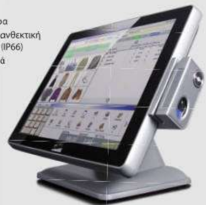
Η ICG διαθέτει διάφορα υψηλής ποιότητας μοντέλα POS με διάφορες επιδόσεις