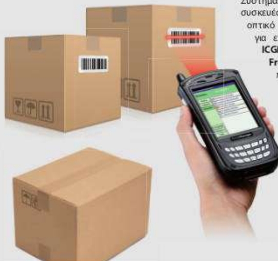
Κινητή λύση για διαχείριση αποθήκης

Σύστημα online για συσκευές χειρός με οπτικό αναγνώστη για επικοινωνία με ICGManager και FrontRetail σε πραγματικό χρόνο.